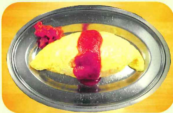
オムライス 830円 Rice omlet