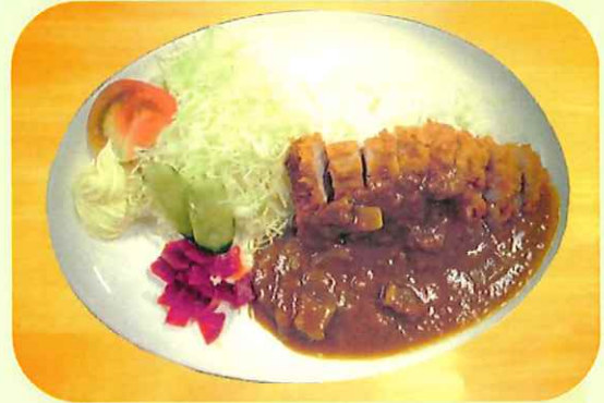
カツカレー 1050円 Katsu - curry