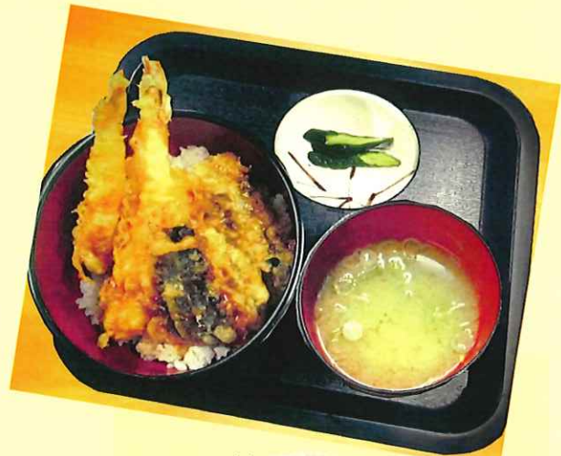
天丼 990円 (tempura bowl)