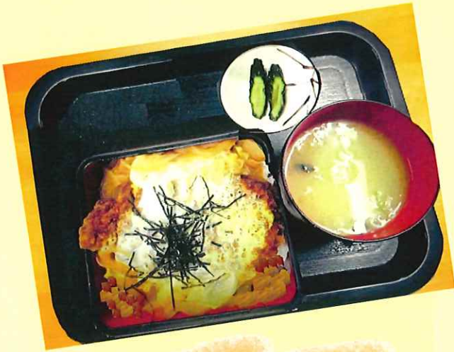
かつ丼 920円 (Poke cutlet bowl)