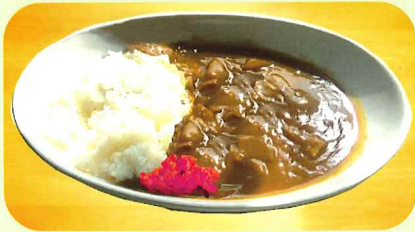
カレーライス 720円 Curry rice