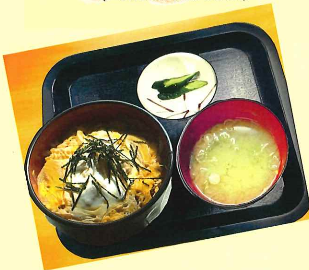
親子丼 850円 (Chicken and egg bowl)