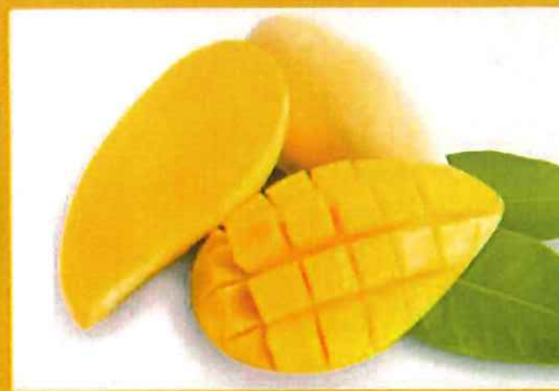
Mango helps prevent diabetes, it supports heart health マンゴーは糖尿病の予防に役立ちます 心臓の健康をサポート