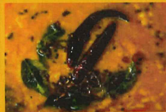
DALL TARKA ダルタルカ ¥ 1050 野菜のピクルスが入った酸味のあるカレー