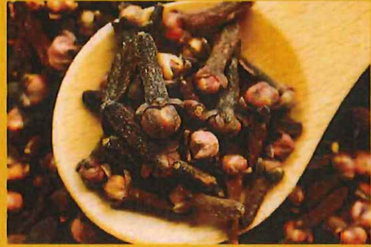
A perfectly-balanced blend of herbs and spices for seafood シーフード用のハーブとスパイスの完璧なバランスのブレンド