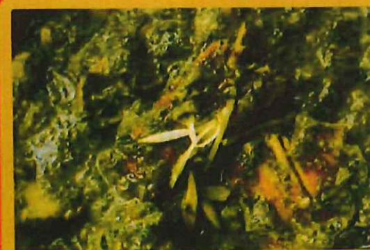
CHICKEN PALAK チキンほうれん草 ¥ 1100 ほうれん草のペースト入り