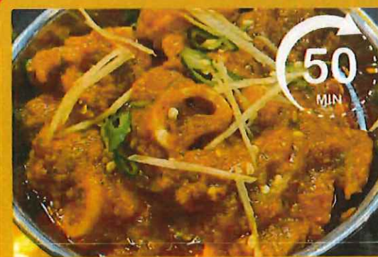
LAMB KARAHI ラムカラヒ ¥ 4500 50分時間を頂きます 3人前