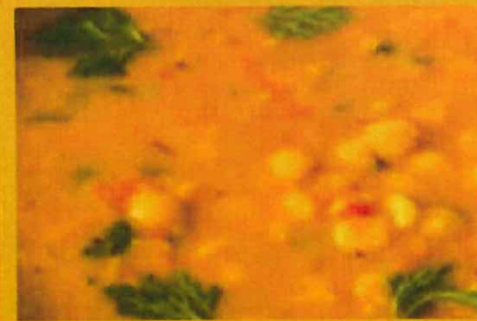
DALL CURRY ダルカレー ¥ 975 お豆のカレー