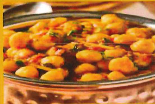
CHANNA MASALA ひよこ豆マサラ ¥ 1000 ひよこ豆のスパイシーカレー