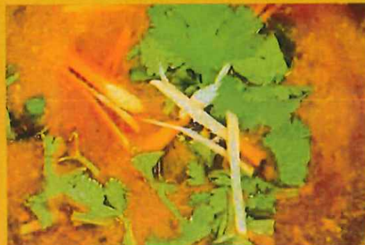
CHICKEN NIHARI チキンニハリ ¥ 1100 このお店でしか食べられない特別なカレーお時間を頂きます。