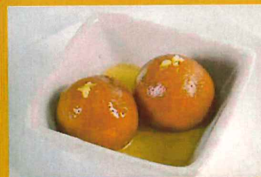
GULAB JAMUN グラブジャムン ¥ 300 ドライ牛乳から作られ生地の揚げ玉甘いシロップ漬けです。