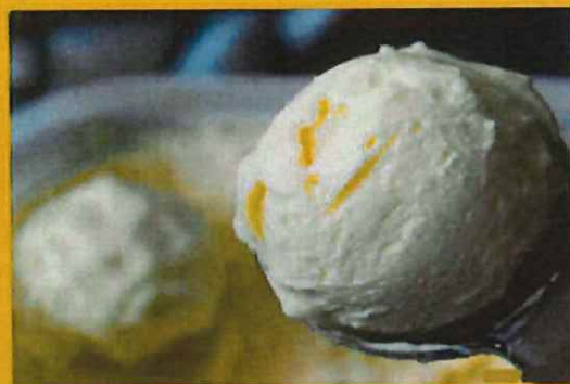
VANILLA ICE CREAM バニラアイスクリーム ¥ 260 クリーミーなバニラアイス