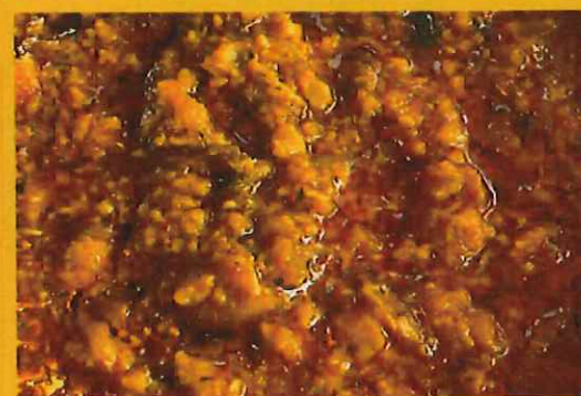
KEEMA CURRY キーマカレー ¥ 1050 お子様でも食べれる野菜とひき肉のカレー