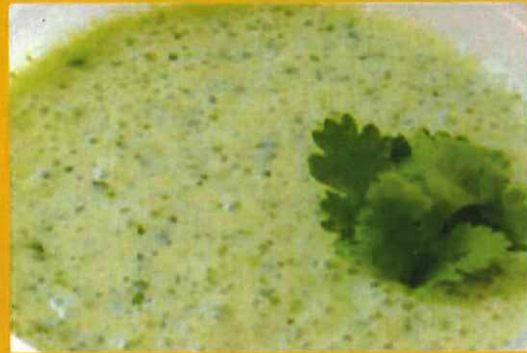
RAITA ライター ¥ 390 ヨーグルトにはミントの味すいた。