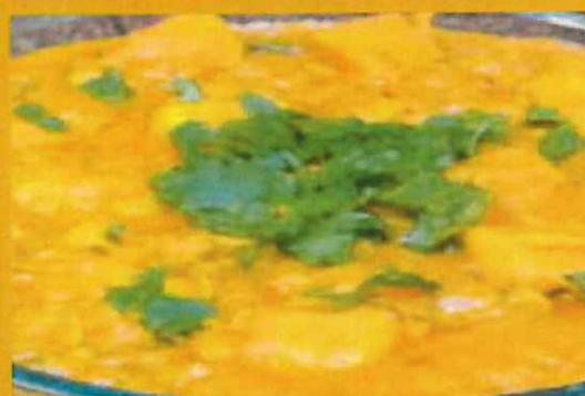
DALL CHICKEN ダルチキン ¥ 1100 お豆とチキンの入ったカレー