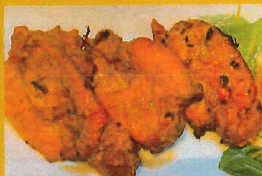
CHICKEN TIKKA 3 pcs チキンティッカ ¥ 560 スパイスの効いた柔らかか蓋焼きチキン