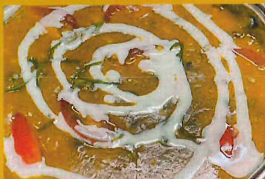
DALL MAKHNI ダルマカニ ¥ 1050 クリーミーな味のお豆のカレー