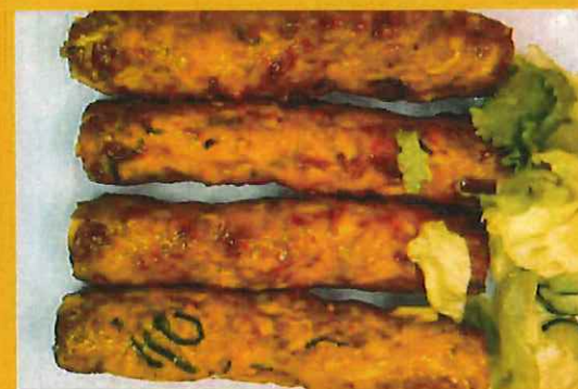
SEEKH KABAB 4 pcs シシカバブ ¥ 1030 鳥挽肉とスパイスニンニクと生差 混ぜて蓋焼き一品です。【つくね】

Turmeric Contains Curcumin, a Substance With Powerful Anti-Inflammatory Effects. ウコンには強力な抗炎症作用のある 物質であるクルクミンが含まれています