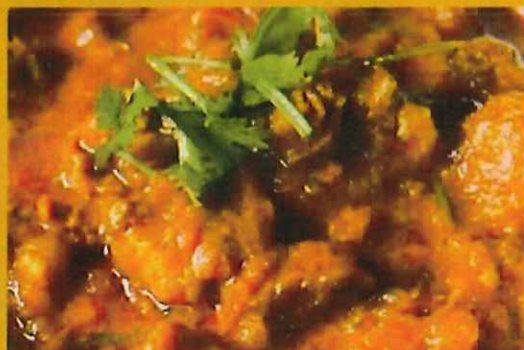
LAMB MASALA ラムマサラ ¥ 1250 マイルドな味のカレー