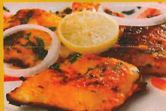
FISH TIKKA 4 pcs 魚ティッカ ¥ 720 スパイスの効いた白身魚