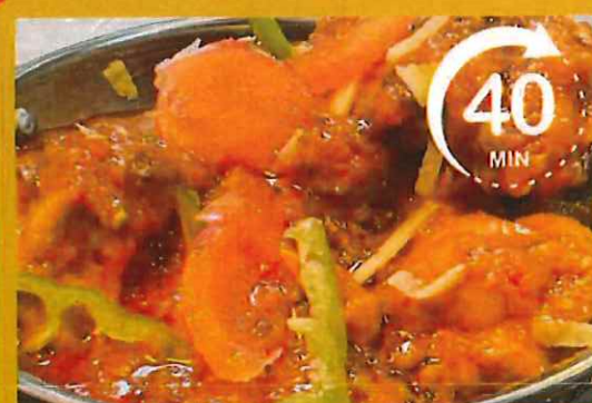
CHICKEN KARAHI チキンカラヒ ¥ 3500 40分時間を頂きます 3人前