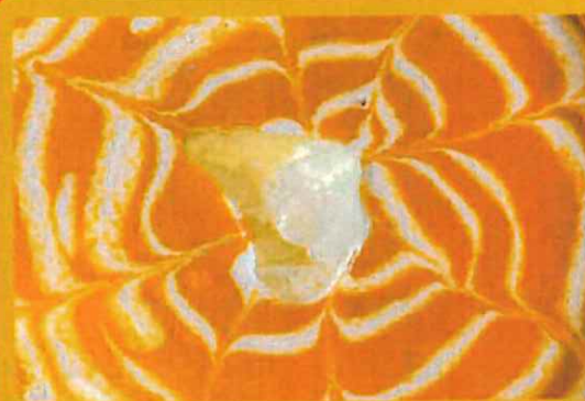
BUTTER CHICKEN バターチキン ¥ 1100 お子様でも食べられるマイルドなカレー