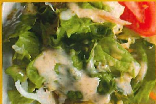
FRESH SALAD フレッシュサラダ ¥ 390 新単なキャベツとニンジンとレタスで出来上がりサラダ