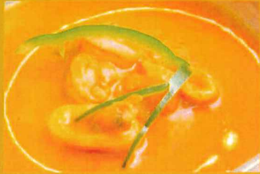
MIX SEAFOOD ミックスシーフード ¥ 1100 シーフード入りのカレー