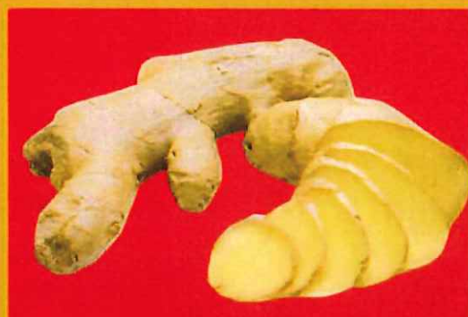
Keep your mouth healthy and Fight off Germs お口を健康に保ち、ばい菌を撃退し ます。