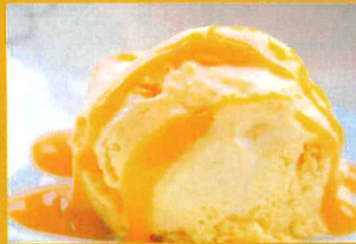
MANGO TOPPING マンゴートッピング ¥ 250 マンゴーシロップ掛けアイス