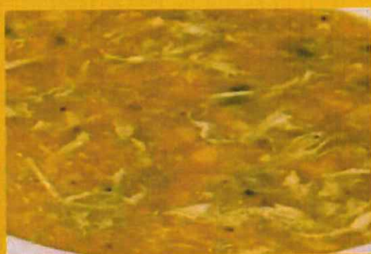
CHICKEN SOUP チキンスープ ¥ 390 鳥肉と野菜と卵入りで出来たスープ