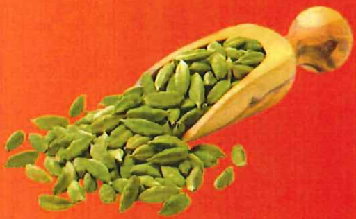
Cardamom relaxes You, Cardamom Benefits on The Skin and Hair. カルダモンはリラックスさせます、それとも肌と髪に良い物である