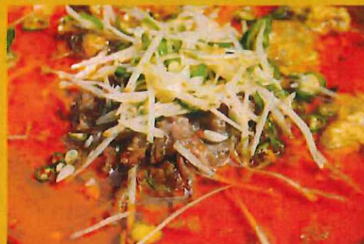
LAMB NIHARI ラムニハリ ¥ 1250 このお店でしか味わえない特別なカレー お時間を頂きます