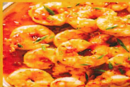
GARLIC SHRIMP ガーリックエビ ¥ 1200 ガーリックで炒めたエと料理