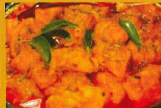
CHICKEN ACHAR チキンアチャール ¥ 1100 野菜のピクルスが入った酸味のあるカレー