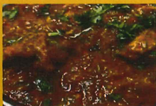
LAMB CURRY ラムカレー ¥ 1100 臭さみのない羊の柔らかお肉カレー