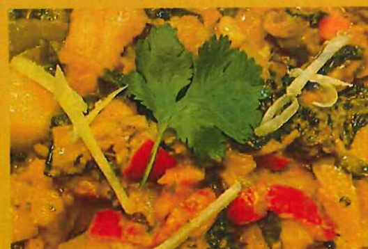
MIX VEGETABLE ミクスベジタブルカレー ¥ 975 多彩な野菜の入ったカレー