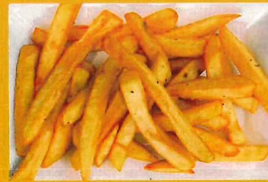
FRENCH FRIES フライドポテト ¥ 300 油で揚げた薄いジャガイモ。