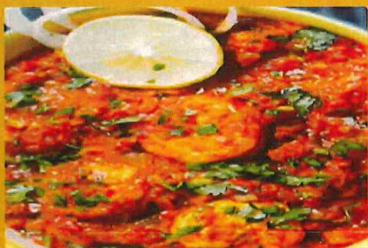
SHRIMP MASALA エビマスラ ¥ 1250 マイルドなエビのカレー