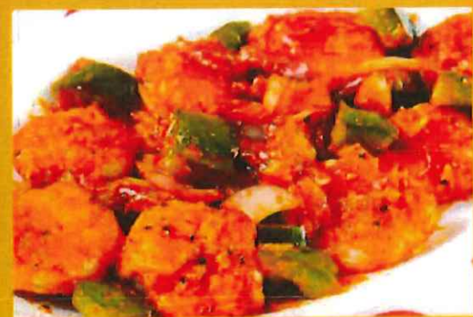
EBI CHILLI 海老チリ ¥ 1200 海の幸海老と新鮮野菜の良い合わせた一品です。