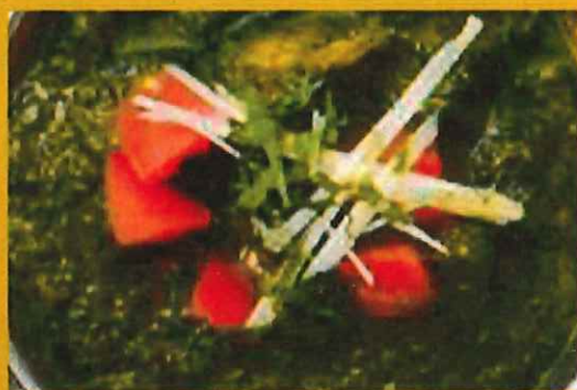
LAMB PALAK ラムほうれん草 ¥ 1250 ほうれん草のペースト入り