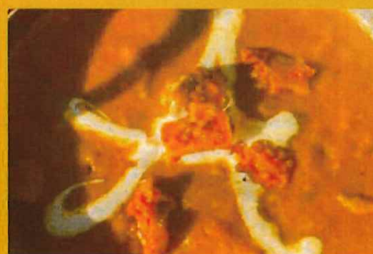
LAMB ACHARI ラムアチャリ ¥ 1150 野菜のピクルスが入った酸味のあるカレー