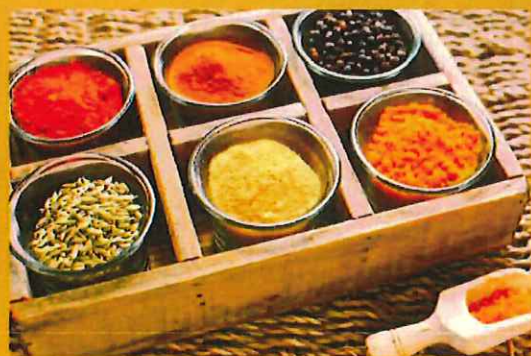
Garam masala helps with digestion, Improves Heart Health. ガラムマサラは消化を助け、心臓の健康を良いします。