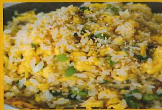
EGG FRIED RICE エッグフライドライス ¥ 600 日本で言う【チャーハン】