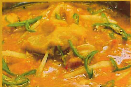
CHICKEN CURRY チキンカレー ¥ 1050 スパイスの効いた柔らか蓋焼きチキン