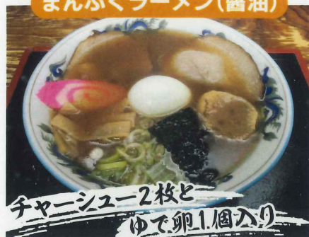
まんぷくラーメン(醤油)